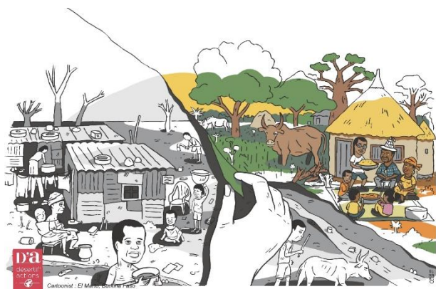
D'a désertif actions 2019 Cartoonist : El Marto, Burkina Faso

El Marto est un artiste multidisciplinaire, tantôt peintre urbain, illustrateur, tatoueur de masque en résine... Son style schématique spécifique, entre dessin de presse et bande dessinée est au cœur de tous ses projets. Depuis qu'il a posé ses valises à Ouagadougou, El Marto enchaîne les projets dans la capitale et les résidences artistiques. Il puise son inspiration dans la culture burkinabè qu'il côtoie au quotidien et dans les différentes cultures qu'il a rencontré au cours de ses voyages.